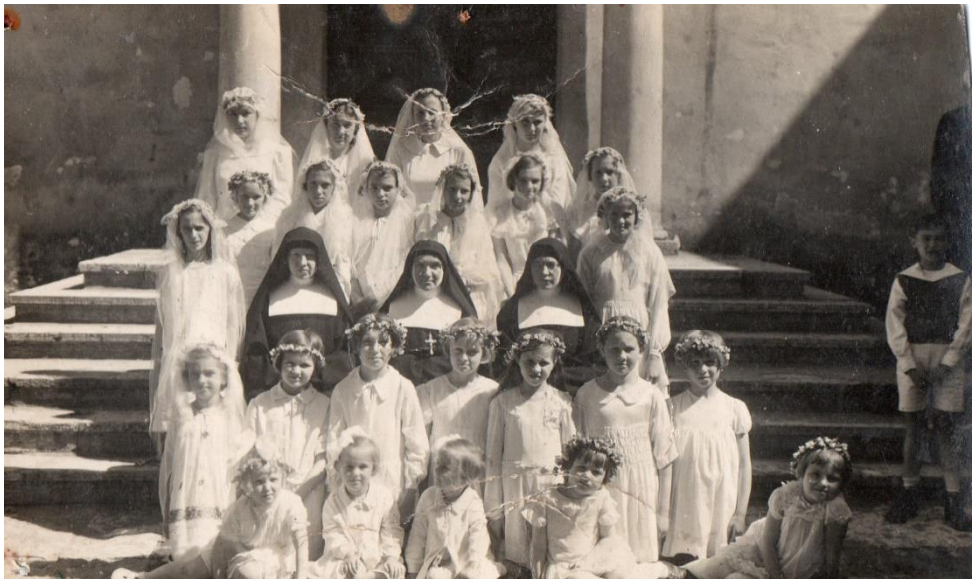
Tallin, Boże Ciało 30.V.1935