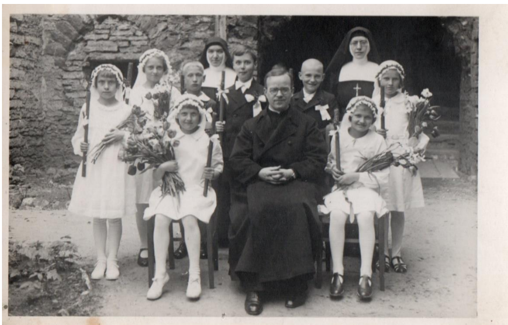
I Komunia Święta - brak daty