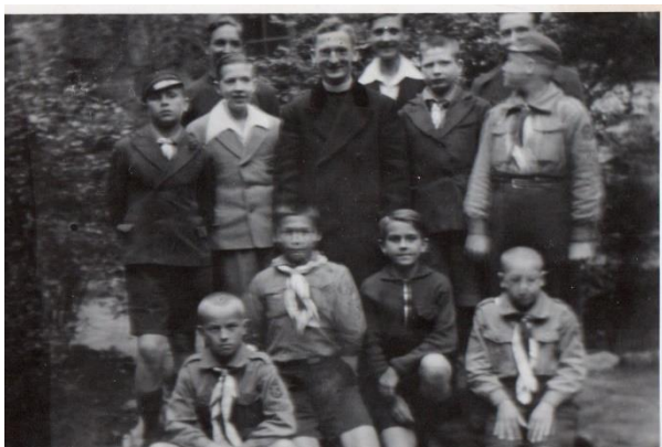
Chłopcy z małego Seminarium z Prefektem