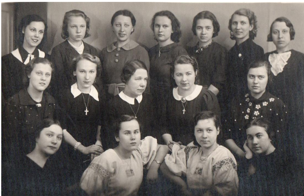
Członkinie Towarzystwa Dobroczynności - miały co tygodniowe spotkania u Sióstr