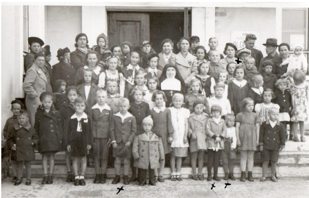
Dzień Matki w szkole w Kivioli 20.V.1940