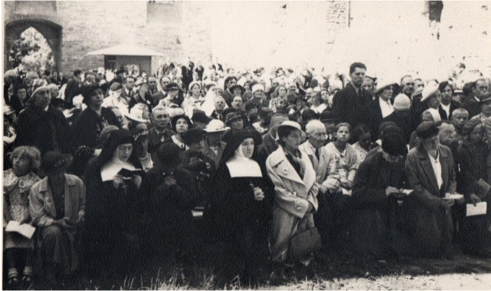
Nabożeństwo przy klasztorze Św. Brygidy