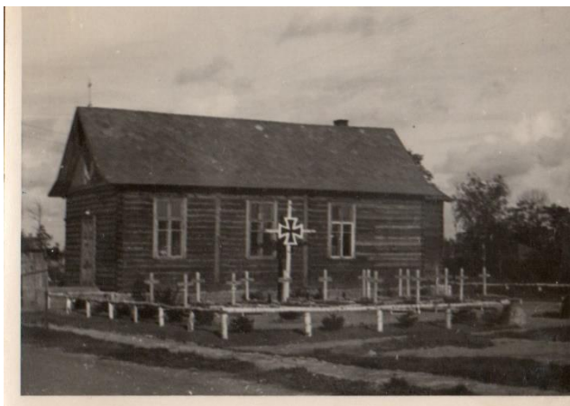
1938 r. Kaplica w Kivioli