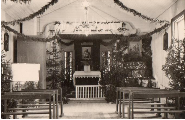
Kaplica wewnątrz - XII.1939 r.