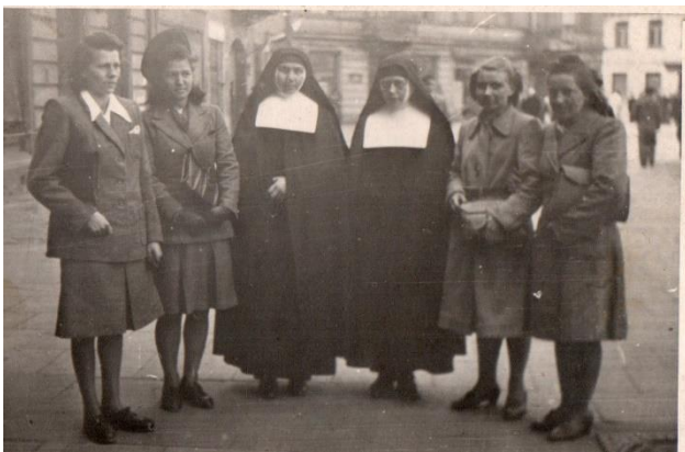
Siostry z dziewczętami