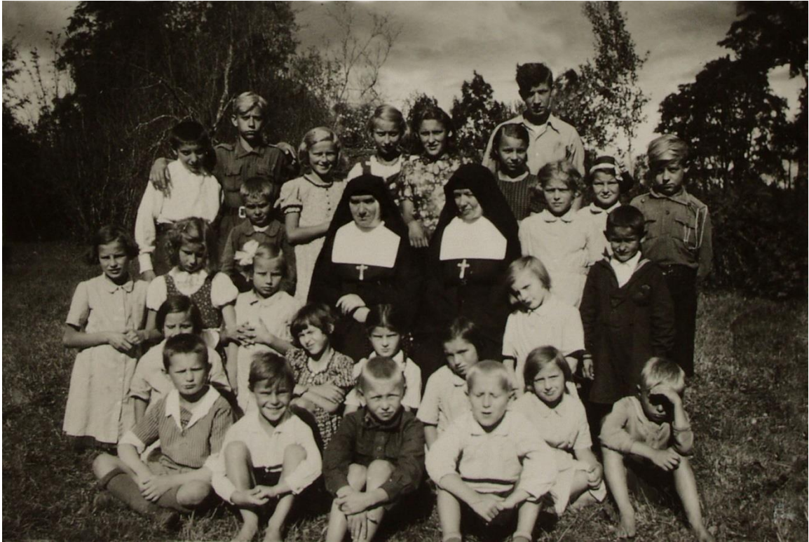
Kolonie w Esna 1940 rok